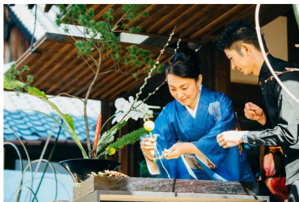
【2016年のセレモニーの様子】