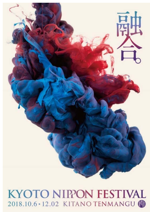
KYOTO NIPPON FESTIVAL 2018 キービジュアル

KYOTO NIPPON FESTIVAL実行委員会は、「KYOTO NIPPON FESTIVAL 2018（以下、KNF）」【会期：2018年10月6日（土）～12月2日（日）、会場：北野天満宮 文道会館】で、現代美術家と乃木坂46がコラボレーションした展示を行うことを決定しました。また、本イベントのチケットを各種プレイガイドにて明日8月23日（木）午前10時より発売すること、本イベントのキービジュアル、刀剣乱舞-ONLINE-とのコラボレーション、が決定しました。